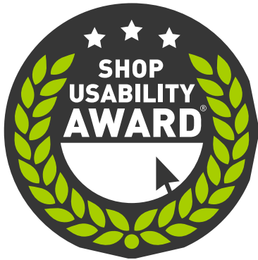
Gewinner des Shop Usability Awards 2020